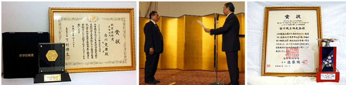
文部科学大臣表彰 技術賞受賞